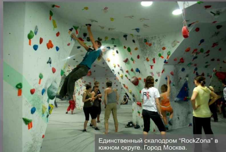
Единственный скалодром "RockZona" в южном округе. Город Москва.

Фитнес клуб, бассейн, скалодром, тренажерный зал, йога, аэробика, танцевальный зал, финские сауны.