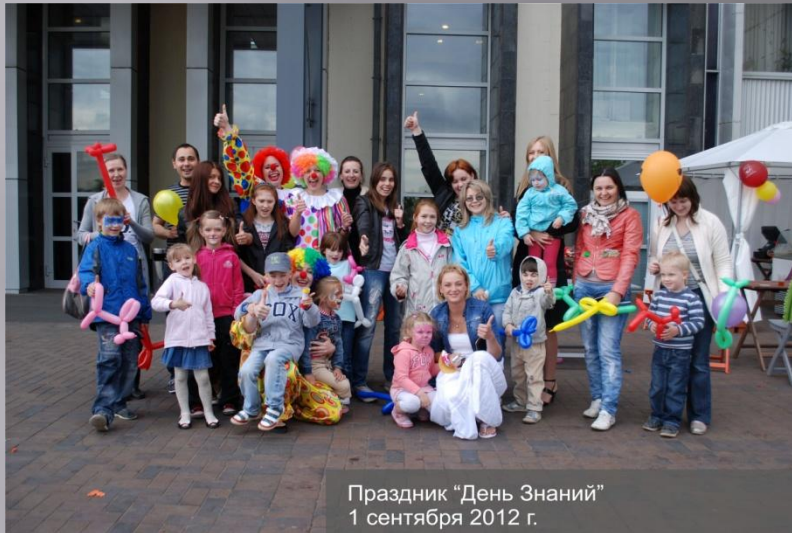
Праздник "День Знаний" 1 сентября 2012 г.