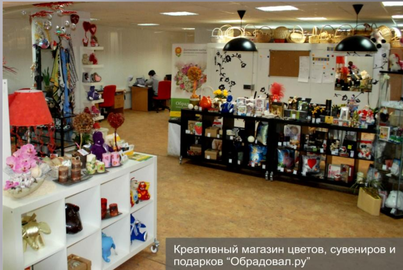
Креативный магазин цветов, сувениров и подарков "Обрадовал.ру"