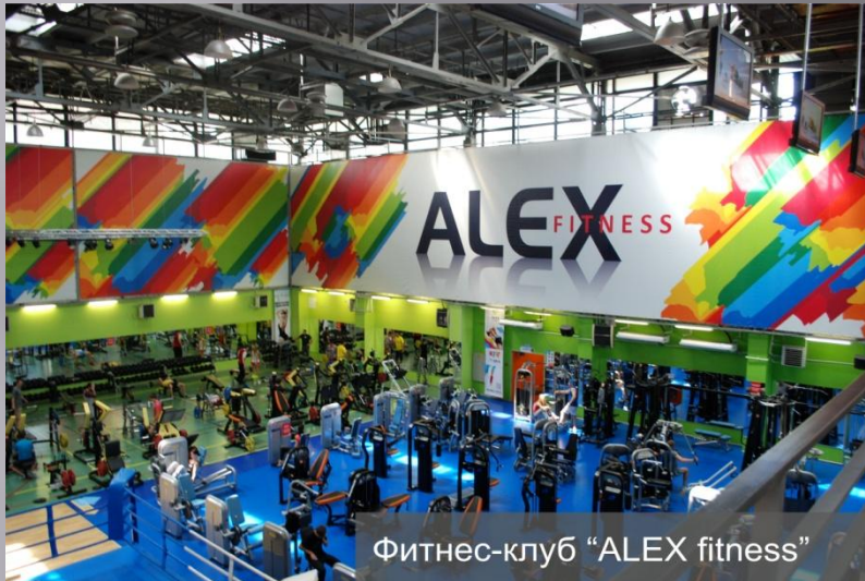
Фитнес-клуб "ALEX fitness"