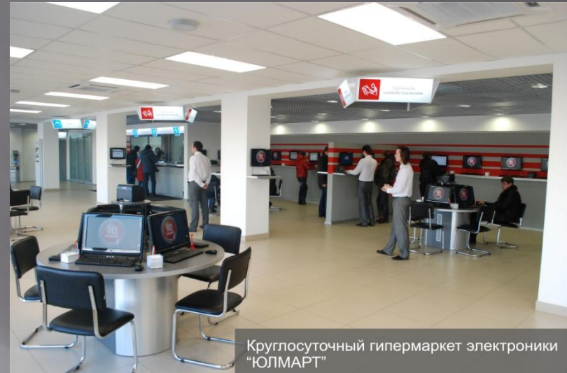
Круглосуточный гипермаркет электроники "ЮЛМАРТ"