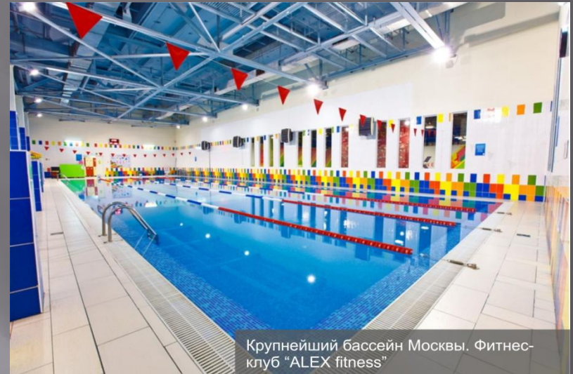
Крупнейший бассейн Москвы. Фитнес-клуб "ALEX fitness"