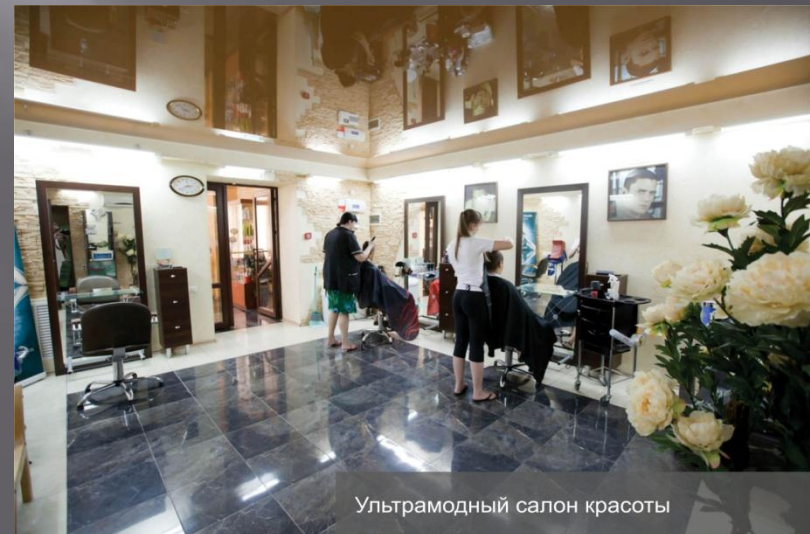
Ультрамодный салон красоты

Салон красоты, минимаркет продуктов, магазин подарков, сувениров и цветов, гипермаркет «Юлмарт», туристические фирмы, нотариус.