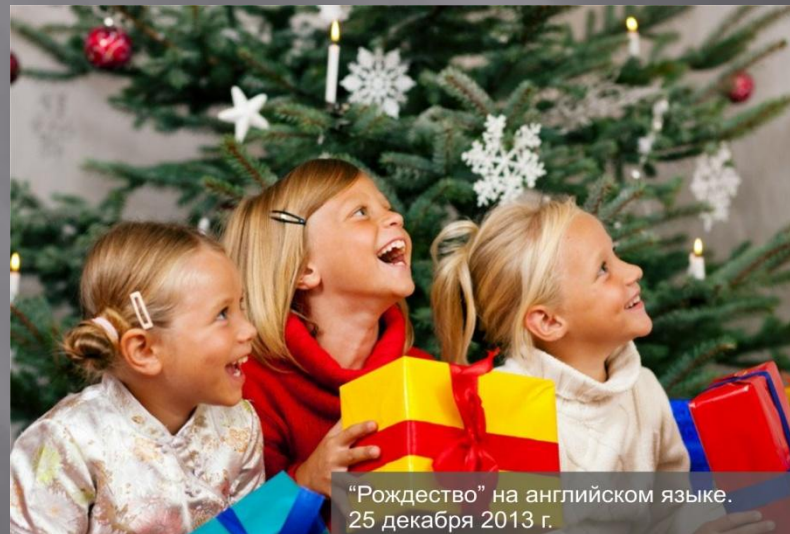
"Рождество" на английском языке. 25 декабря 2013 г.

Праздники, мастер-классы, поздравительные мероприятия проводятся для арендаторов и их детей.